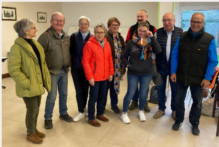
Les bénévoles de la Banque Alimentaire

Il assure également la distribution mensuelle de l'aide alimentaire pour les communes de l'ex-Communauté de communes Vienne et Moulière. Cette aide alimentaire soutient 65 familles, soit environ 140 personnes. Une quinzaine de bénévoles, hommes et femmes, se mobilisent le deuxième mardi de chaque mois pour préparer les colis, en assurer la distribution et accueillir comme il se doit les bénéficiaires en leur prêtant une oreille attentive.