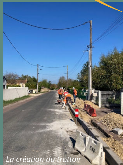
La création du trottoir